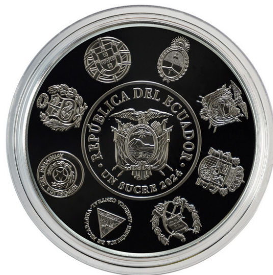
Figura 221. Características de las monedas

El diseño destaca en el anverso los escudos de armas de los ocho países participantes: Argentina, Ecuador, España, Guatemala, Nicaragua, Paraguay, Perú y Portugal; y, en el reverso, el Palacio de Carondelet, Catedral de Quito y el Monumento de la Independencia.