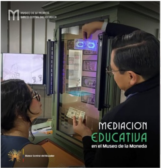
Figura 217. Mediaciones educativas del Museo de la Moneda de Quito Atención al público visitante con contenidos en exposición permanente