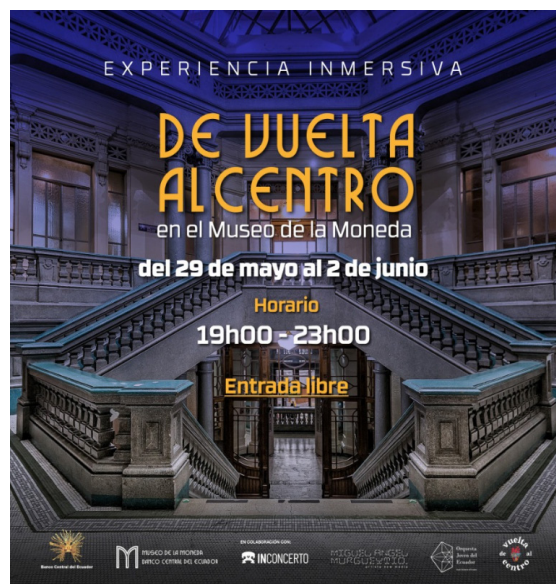
Figura 214. Lucerna: obra lumínica del artista Miguel Ángel Murgueytio